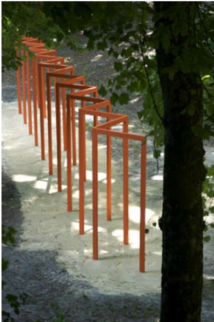
Torii , installation in-situ dans le parc Baron, Fontenay Le Comte, bois peint en orange 9x2.5x1m, 2008

carolerivalin@yahoo.fr - http://www.carolerivalin.com