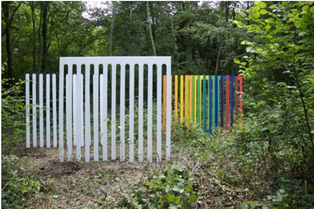
Palissades , Le vent des Forêts 2008 Installation in situ, 4 structures en bois 2.5mx3mx3cm, peinture blanche, peinture dégradée de couleur